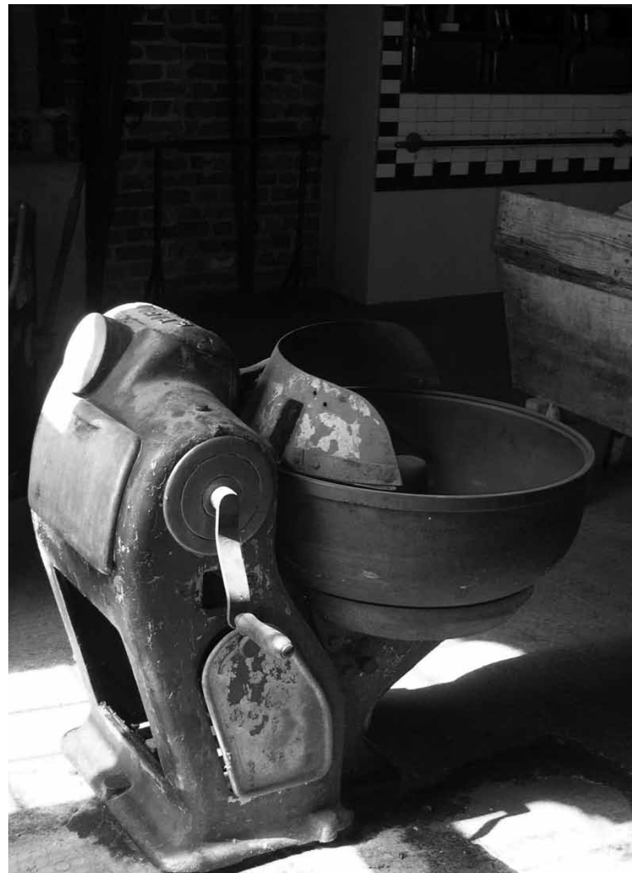
Impastatrice da pane, a motore, con possibilità di movimentazione manuale (Museo del grano e del pane, S. Angelo Lodigiano)

Dalla macinazione delle cariossidi di frumento tenero si ottengono: la farina , la crusca , il farinaccio ed il germe . La crusca, il farinaccio e il germe sono destinati prevalentemente all'alimentazione animale mentre solo in piccole quantità sono utilizzati come prodotti dietetici in quanto ricchi di fibra, sali minerali e vitamine. La farina assume, tramite il setacciamento, classificazioni diverse corrispondenti anche ad una diversa composizione chimica. Da qui deriva la suddivisione: due , uno , 0 (zero)