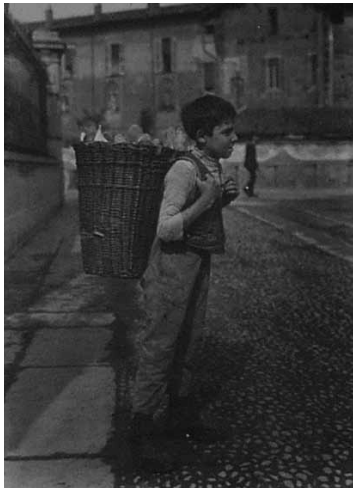
Trasporto del pane in gerle di vimini (Museo del pane e del grano, S. Angelo Lodigiano)

e 00 (doppio zero), oltre al tipo integrale . Il tipo due è, rispetto al tipo 00 , meno raffinato, di un colore più paglierino e con un maggiore contenuto in sali minerali e proteine. Le farine più commercializzate sono la 0 e la 00 , in quanto il consumatore, che trova in altri prodotti vegetali diversificati apporti di fibre e di sali, si è spinto sempre più verso un pane il più bianco possibile.