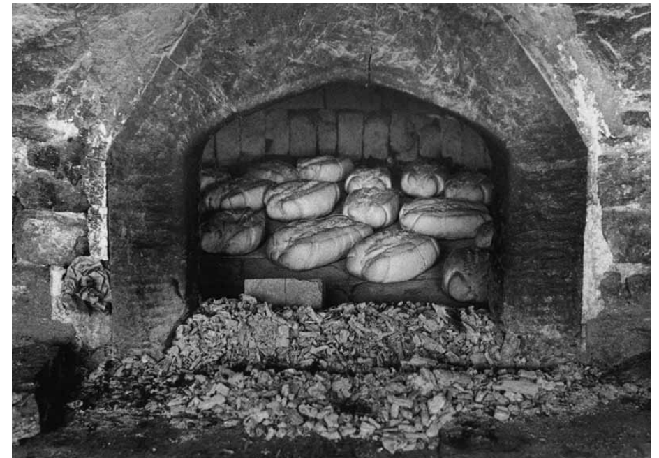
Forno a legna con pane appena cotto

La produzione nazionale di frumento tenero (280.000 t) è destinata alla produzione di pane (65%), prodotti dolciari (12%), pizze e ad altri usi alimentari domestici (5%) mentre la quota destinata alla produzione di pasta è ridotta (1%). La produzione è inoltre deficitaria per cui annualmente importiamo circa il 60% del nostro fabbisogno nazionale. In funzione di tale situazione non si intravedono, per il futuro, prospettive di destinare la nostra produzione alla trasformazione in bioetanolo, come invece sta avvenendo in altri Paesi dell'Unione Europea.