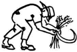
Dalla mietitura a mano a quella meccanizzata, movimentata da animali (Museo del grano e del pane, S. Angelo Lodigiano)